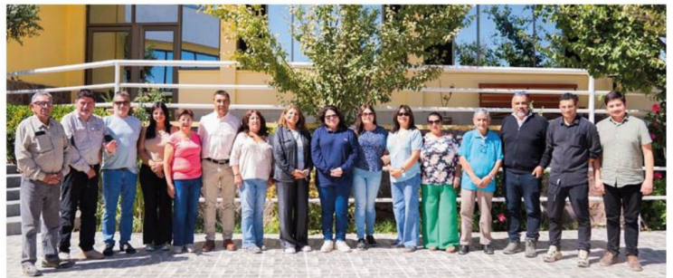
También es un activo participante de la Mesa CAT en representación del Sindicato de Pirquineros.

Más allá del impacto directo en los pirquineros, Véliz enfatiza que se trata de un proyecto con alcance comunitario. “Esto no solo nos ayudará a nosotros, es un beneficio para toda Andacollo”, sostuvo, destacando además el aporte ambiental al eliminar el uso de mercurio en los procesos. Actualmente, el sindicato cuenta