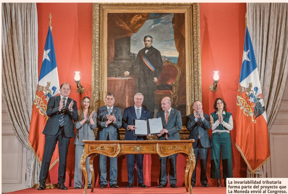
La invariabilidad tributaria forma parte del proyecto que La Moneda envió al Congreso.

riabilidad tributaria y los de derecha más a favor".