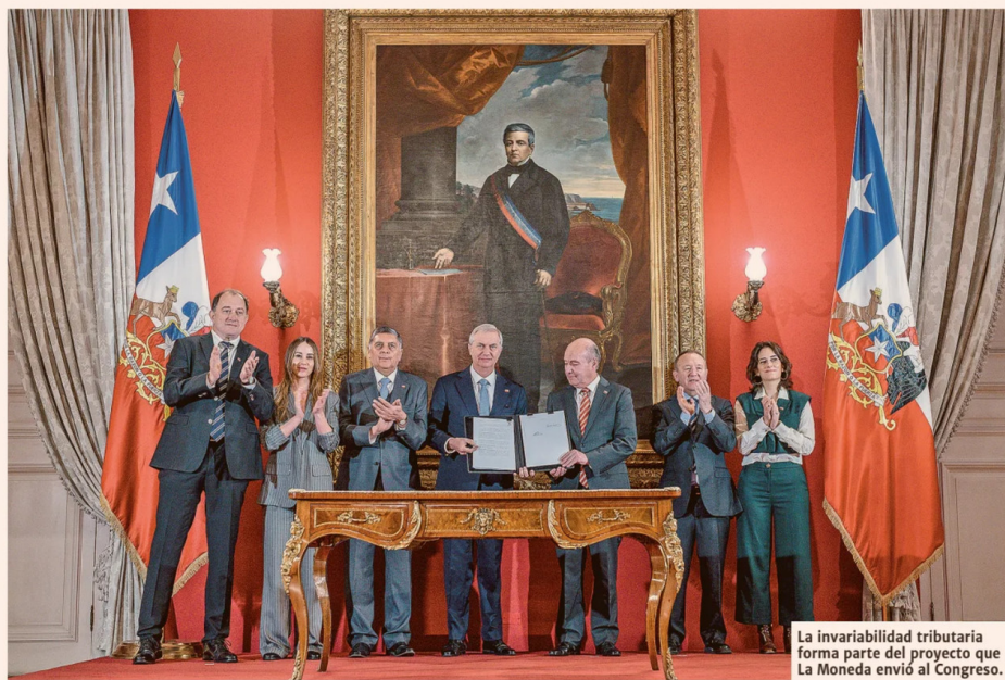
La invariabilidad tributaria forma parte del proyecto que La Moneda envió al Congreso.

riabilidad tributaria y los de derecha más a favor".