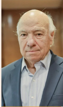
VITTORIO CORBO , EXPRESIDENTE DEL BANCO CENTRAL.

“No hay evidencia respecto de su impacto en el crecimiento; rigidiza las políticas tributarias”.