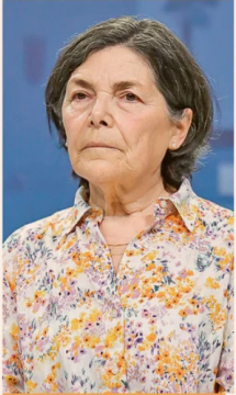
PAULINA SABALL , EXMINISTRA DE ESTADO.

“No hay evidencia respecto de su impacto en el crecimiento; rigidiza las políticas tributarias”.