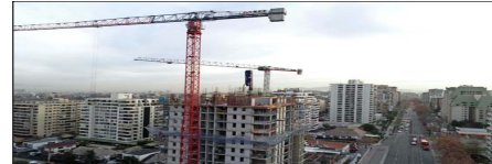
La banca recibió —al 24 de abril— 76.688 solicitudes de subsidio a la tasa hipotecaria. 44.005 están aprobadas y 26.135 en evaluación, dijo la ABIF.

Más optimista fue Reinaldo Gleisner, vicepresidente de Colliers. Sostuvo que "el alza en los permisos, sin duda, son 'brotes verdes'. Es el resultado de un sector que comienza a ver señales de normalidad y que apuesta por los cambios estructurales en curso. No estamos aún en niveles óptimos, pero los cimientos para una recuperación sosteni-