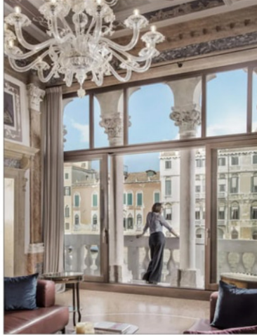
Por cuidado de patrimonio, los estucos, espejos y lámparas de estos palacios no pueden intervenir.

"Es un palacio precioso desde afuera. Todos los palacios que están en esa zona son maravillosos. Son como cuatro kilóme-