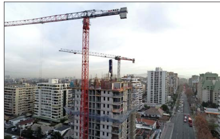
La banca recibió —al 24 de abril— 76.688 solicitudes de subsidio a la tasa hipotecaria. 44.005 están aprobadas y 26.135 en evaluación, dijo la ABIF.

Más optimista fue Reinaldo Gleisner, vicepresidente de Colliers. Sostuvo que "el alza en los permisos, sin duda, son 'brotes verdes'. Es el resultado de un sector que comienza a ver señales de normalidad y que apuesta por los cambios estructurales en curso. No estamos aún en niveles óptimos, pero los cimientos para una recuperación sosteni-