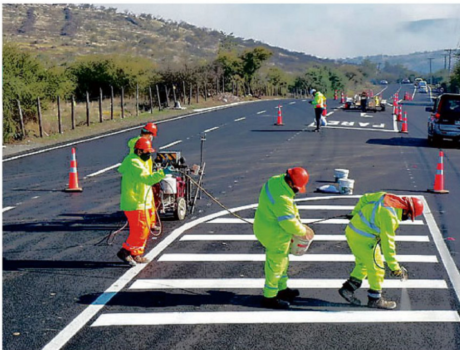
TRABAJOS DE MANTENCIÓN VIAL BUSCAN MEJORAR EL TRÁNSITO EN RUTAS DE LA PROVINCIA DE SAN ANTONIO.

El ministro de Obras Públicas, Martín Arrau, explicó el escenario que motivó la medida. "Encontramos una situación muy compleja que es el abandono en muchos caminos, dado que los contratos globales de mantención no están al día. Varios