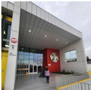
→ Instituto Teletón O'Higgins.

Respecto a la procedencia de los usuarios, las cifras indican que las comunas con mayor número de pacientes activos corresponden a Rancagua, Machali, Rengo y San Fernando. En contraste, Pumanque se posiciona como la comuna con menor cantidad de usuarios, registrando actualmente cinco personas en atención. Otro de los aspectos destacados por la dirección del instituto dice relación con