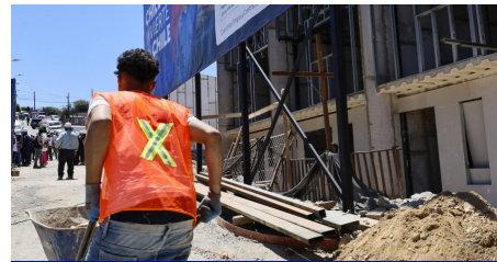
Demolición de casas en El Olivar queda en manos de la justicia tras ofensiva judicial contra el Ministerio de Vivienda y Urbanismo