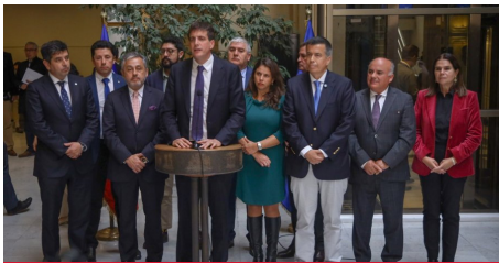
Bancada RN impulsa proyecto de ley para endurecer sanciones por secuestro ante avance del crimen organizado