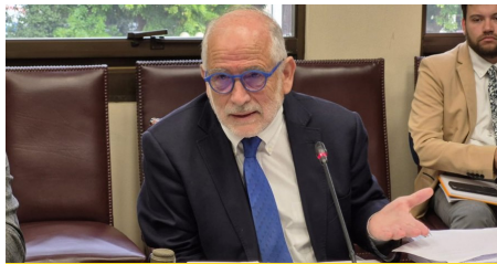
Montes por reproches a compras de terreno: "Interpretar sobreprecio es como decir que el Estado está en quiebra: no es verdad"