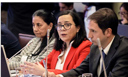
La presidenta del CFA, Paula Benavides, expuso ayer por la tarde en la comisión de Hacienda de la Cámara de Diputados.

Valora que la propuesta "priorice el crecimiento económico", pero alertó que se presentan déficits al menos hasta 2031. Sugiere a Hacienda analizar mitigaciones.