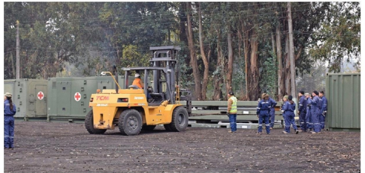
EL HOSPITAL DE CAMPAÑA del Ejército estará operativo entre el 18 de mayo y el 5 de junio.

En este contexto, "se necesita experiencia para la nivelación del terreno, la