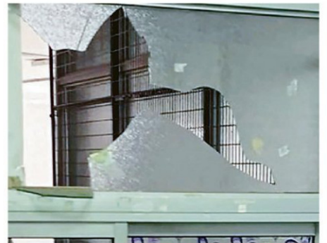
ANTISOCIALES ROMPIERON VIOLENTAMENTE LA INFRAESTRUCTURA.

A propósito de ello, "los equipos jurídicos están preparando todos los