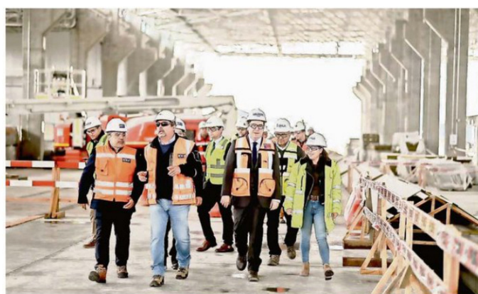
AUTORIDADES Y EJECUTIVOS DURANTE EL RECORRIDO POR LA OBRA.