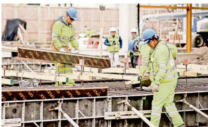
EL AVANCE ES CERCANO AL 80%.