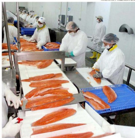
SE BUSCA REACTIVAR LA COMPETITIVIDAD DEL SECTOR SALMONICULTOR.