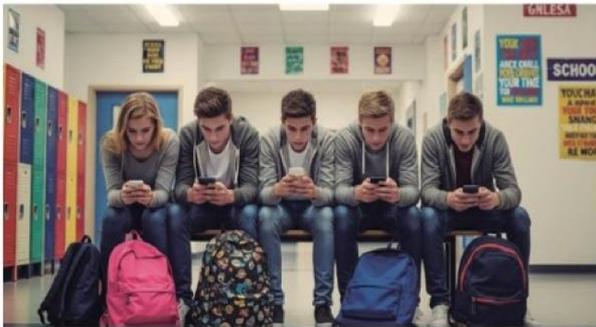
El análisis reunió datos de más de 363.000 menores de entre dos y 19 años.

Los resultados muestran que la relación entre plataformas digi-