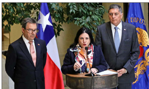
RESPALDO A MINISTRA.— El titular de Defensa, Fernando Barros (derecha), destacó la coordinación que realizó su par de Seguridad, Trinidad Steiner, en el operativo. En la foto, junto al jefe de Interior, Claudio Alvarado.

Steiner explicó que la formalización de los detenidos se realiza "en atención a una investigación realizada desde 2025, por los delitos de robo con violencia, incendio y disparos injustificados". Destacó que durante el desarrollo de las acciones no hubo carabineros lesionados, pero aclaró que