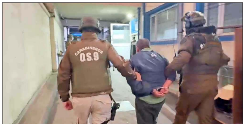
ATAQUES EN LA PRINCIPAL CARRETERA DEL PAÍS.— La indagatoria contra los miembros de la comunidad Temuicui que vincula con atentados en la ruta 5 Sur, entre otros ilícitos.