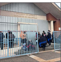
COLLIPULLI.— Hasta el tribunal llegaron familiares de los miembros de Temuicui.

tigativo encabezado por el OS9 de Carabineros y que eran buscados con órdenes de detención, mediante el ingreso y registro de sus domicilios. Estos fueron individualizados con las siglas A.Q.H. (hombre, 18), quien no presenta antecedentes penales ni policiales; R.D.H.Q. (mujer, 45), también sin antecedentes; y L.P.Q.H. (hombre, 29), con antecedentes por manejo en estado de ebriedad, porte de arma cortante y consumo de drogas; y de M.D.Q.H. (mujer, 41), con antecedentes por oponerse a la acción de la autoridad, usurpación de propiedad y maltrato de obra a carabineros.