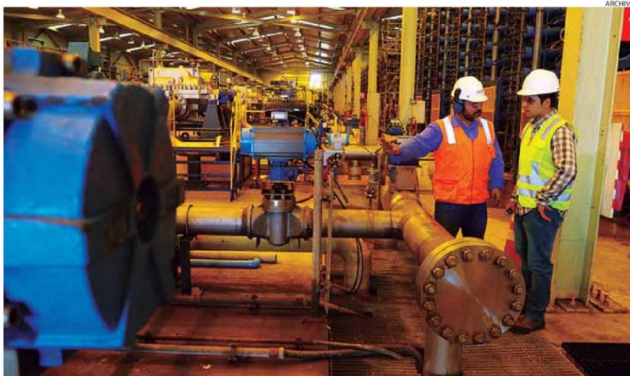
LA REGIÓN DE ANTOFAGASTA ES LÍDER EN DESALINIZACIÓN EN LATINOAMÉRICA, CON 13 PLANTAS OPERATIVAS.

"ya tiene infraestructura madura y masiva: varias plantas abastecen cerca del 60% del agua potable regional, con ciudades como Tocopilla o Antofagasta abastecidas 100% por agua de mar".