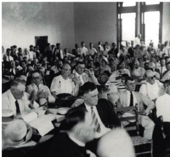
El juicio atrajo la atención mediática con la cobertura de cientos de periodistas y la transmisión en directo por radio, convirtiéndose en un evento histórico para la prensa de Estados Unidos.