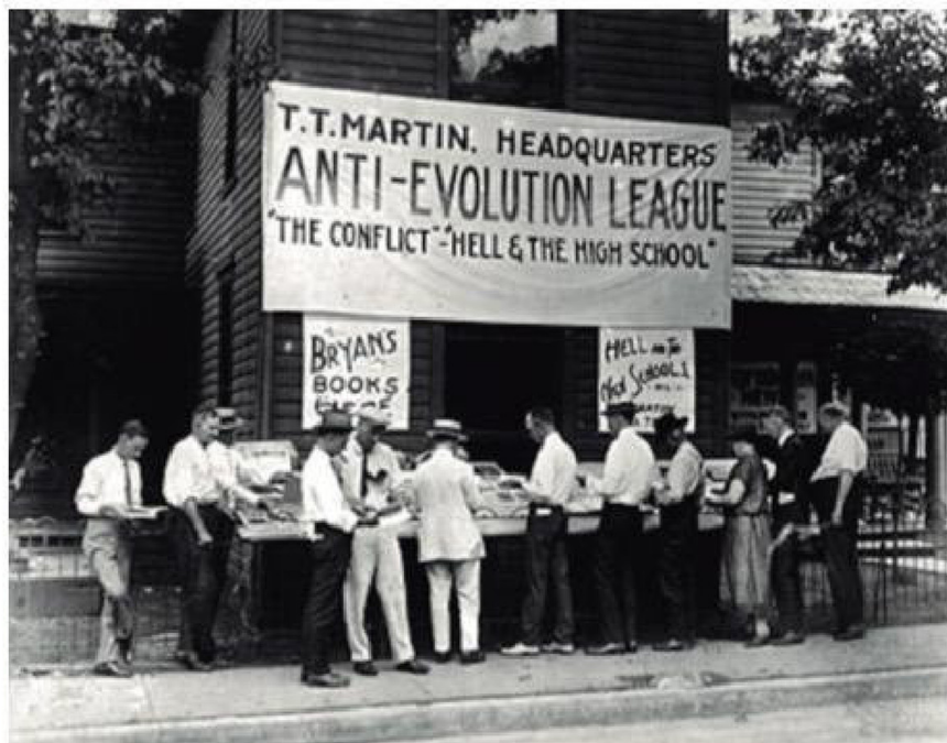
La Ley Butler, aprobada en Tennessee en 1925, prohibió la enseñanza de cualquier teoría que negara la Creación Divina según la Biblia en instituciones públicas.