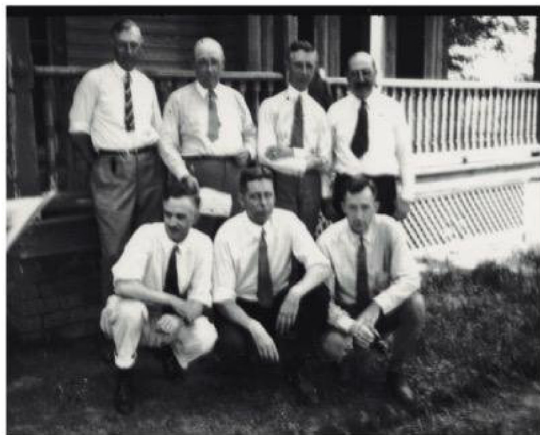
La Ley Butler no fue derogada hasta 1967, pero el juicio de Scopes sentó un precedente clave en la defensa de la enseñanza de la evolución y la laicidad escolar en Estados Unidos. En la foto, los científicos que apoyaron al docente acusado