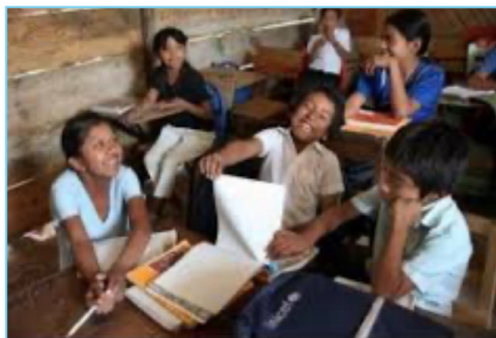
La baja inversión en educación ha sido uno de los factores del retraso en América Latina.

Los Estados latinoamericanos no son dispendiosos solamente porque perpetúan una herencia colonial. Lo son más porque intentan pacificar, mediante altos gastos sociales, movimientos reivindicativos. Es un trabajo que hizo magistralmente la izquierda en Venezuela, Bolivia y luego Chile (octubre de 2019), pero la gran mayoría ciudadana ya está harta de este tipo de políticas violentistas y