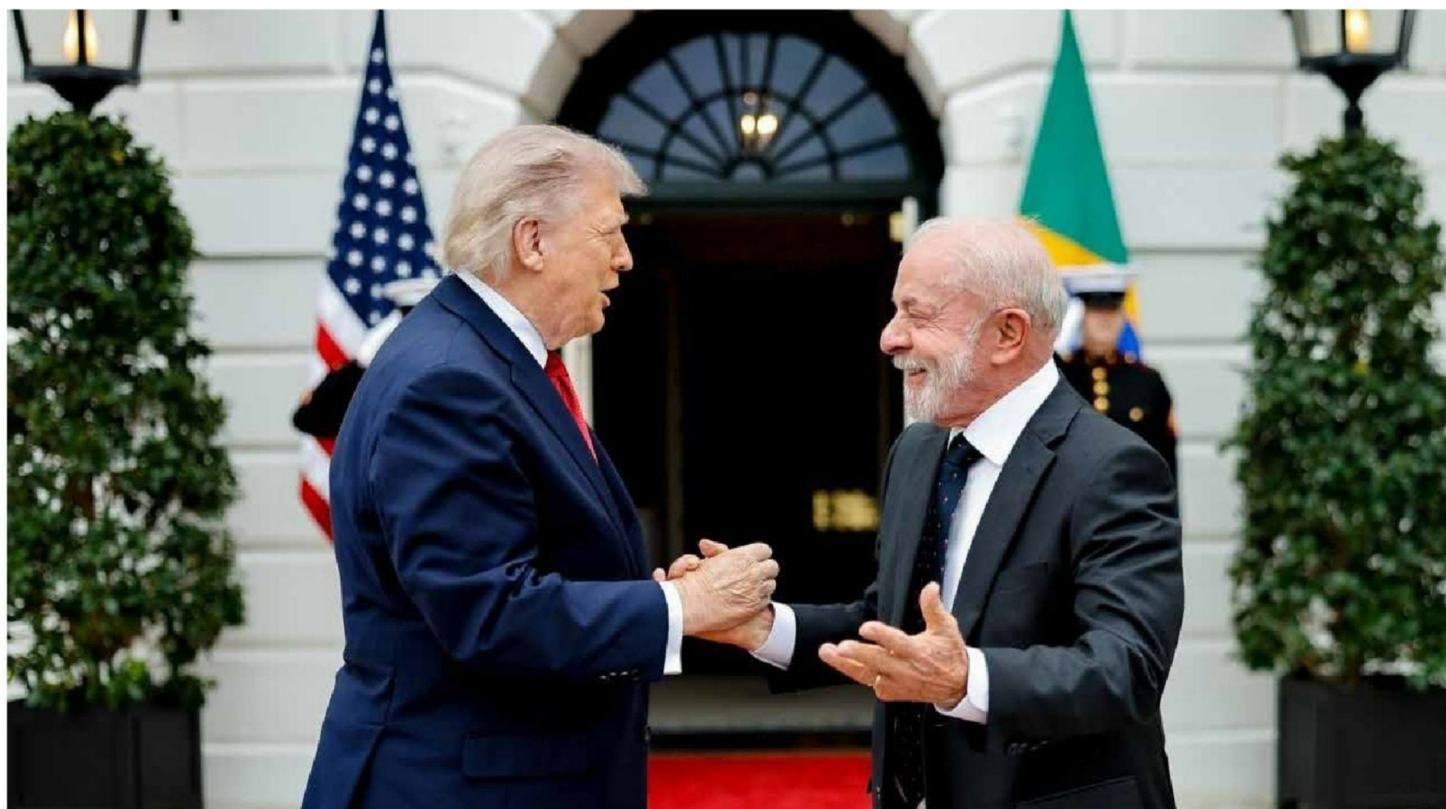
► El Presidente de Brasil, Luiz Inácio Lula da Silva, en la Casa Blanca este jueves 7 de mayo junto el Presidente de Estados Unidos, Donald Trump.