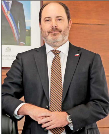
El ministro del Trabajo, Tomás Rau, coordinará el trabajo de la mesa técnica preempleo.

mites de la iniciativa son eventuales ajustes a las propuestas laborales que están contenidas en el proyecto. Las materias en evaluación, y que han recibido varias observaciones durante la etapa de audiencias en la comisión de Hacienda de la Cámara, son el crédito tributario a las empresas para proteger el empleo formal y la eliminación de la franquicia tributaria que maneja el Servicio Nacional de Capacitación (Sence).