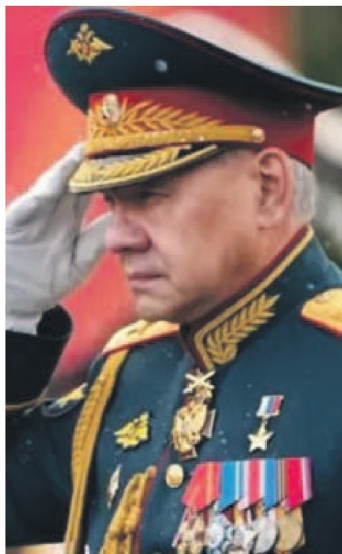
RADIO BIOTIO / X

Uno de los puntos más delicados del documento es la referencia al exministro de Defensa, Serguéi Shoigú, histórico aliado y amigo cercano de Putin.