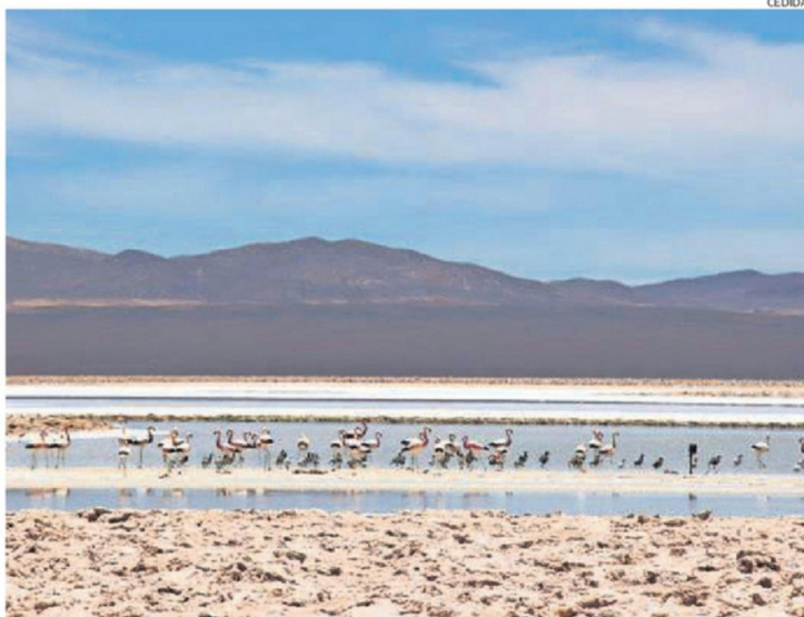
PEINE DIJO QUE LAS CONSIDERACIONES ECONÓMICAS COMPROMETEN SU SUBSISTENCIA MATERIAL Y CULTURAL.

además, los ministros de Salud, May Chomali; de Economía, Fomento y Turismo y Minería, Daniel Mas; y de Agricultura, Jaime Campos, quienes evaluaron los antecedentes técnicos y ambientales presentados en el recurso de reclamación del titular antes de resolver favorablemente la iniciativa. Con esta decisión, el proyecto SLM NX Uno de Peine logra destrabar su tramitación ambiental y avanzar hacia su desarrollo productivo en la comuna de San Pedro de Atacama, en una zona donde la explotación