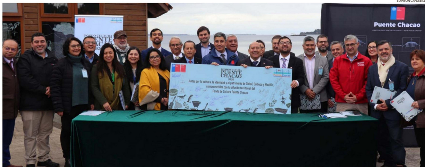
EN CHACAO SE REALIZÓ AYER EL LANZAMIENTO DE LA PRIMERA CONVOCATORIA DEL FONDO QUE NACIÓ COMO COMPENSACIÓN A LA CONSTRUCCIÓN DEL PUENTE QUE UNIRÁ CHILOÉ CON EL CONTINENTE.

Organizaciones sociales, culturales y comunitarias de las diez comunas de la provincia de Chiloé, así como Calbuco y Maullín, pueden postular a las distintas líneas de financiamiento. El plazo se extiende hasta el 25 de junio.