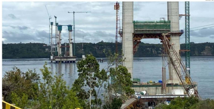
PARA OCTUBRE DEL 2028 ESTÁ PROGRAMADO EL FIN DE LOS TRABAJOS DEL VIADUCTO, LA MAYOR OBRA EN CONSTRUCCIÓN EN CHILE.

En el caso de la línea de difusión, las personas naturales pueden acceder a un