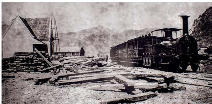
Esta es la locomotora "Vencedora", realizando trabajos en la estación de La Calera, en la década de 1860. Fue la primera máquina en llegar a la ciudad, causando el asombro y la admiración de los vecinos.

La nueva república de Chile comenzó a organizarse administrativamente en todo su territorio, razón por la cual el 30 de agosto de 1826, el país fue dividido en 8 provincias. Una de esas provincias fue la de Aconca-