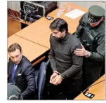
El excongresista ingresó al anexo Capitán Yáber.