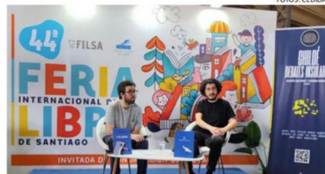
LOS EDITORES ESTUVIERON EN LA ÚLTIMA FERIA INTERNACIONAL DEL LIBRO DE SANTIAGO (FILSA), EN DICIEMBRE DEL AÑO PASADO.