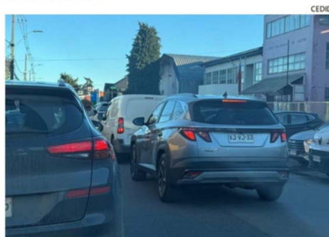
LOS ATOCHAMIENTOS INCLUSO SE HAN VISTO EN EL CENTRO.