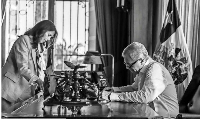
En sus dos primeros meses, Kast duplica las actividades públicas hechas por su antecesor, Gabriel Boric.

La defensa de Palacio tendrá un respaldo en la agenda. Según una comparación interna de actividades presidenciales entre los primeros meses de Gabriel Boric y José Antonio Kast, el actual mandatario registra 136 actividades públicas entre el 11 de marzo y el 7 de mayo, frente a 68 de Boric entre el 11 de marzo y el 11 de mayo (ver infografía). También registra 37 lugares distintos, casi el doble que los 19