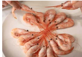
RINCÓN DE QRRO. Este bar se luce con sus quisquillas de Motril.