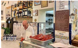
PROVINCIAS. Un bar clásico para pasar a "tardear".

Sin dejar el centro, otro clásico es Bodegas Castañeda ( Almireceros, 1, 3 ). Con casi un siglo de historia, es conocido por sus vinos y vermú que sirven acompañados de una variada propuesta de tablas de ibéricos. Si lo que se quiere es pescadito frito, el lugar es Los Diamantes ( Navas, 28 ). Su especialidad son los boquerones, el cazón y los calamares fritos.