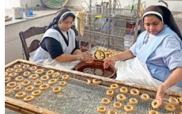
CONVENTO SAN JOSÉ. Carmelitas calzadas preparan roscos de almendra.

de la casa: la ensaladilla, con solo tres ingredientes, mayonesa, gambas y patata, de la que pueden llegar a hacer hasta 100 kilos en Navidad.