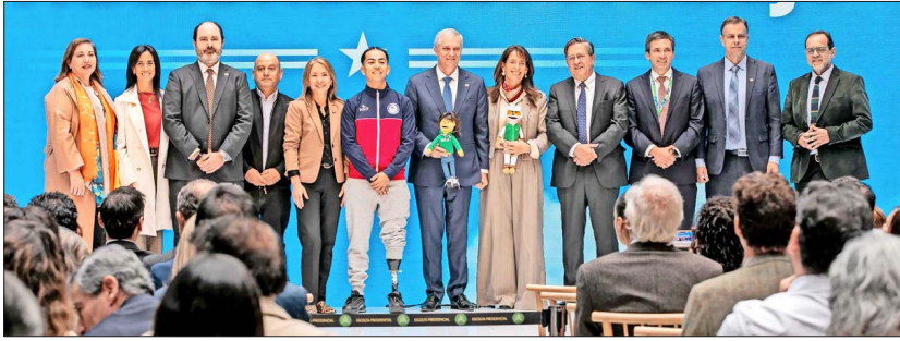
Presidente de la República, José Antonio Kast, junto a autoridades y representantes de la Achs.