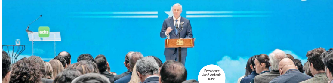
Presidente José Antonio Kast.