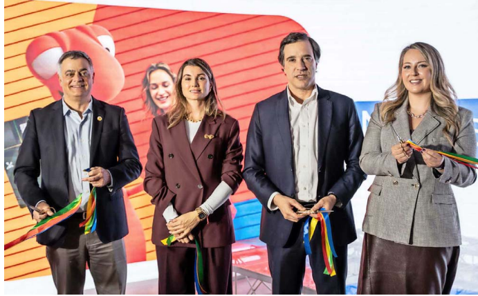
Con el corte de cinta se inauguró la nueva Sucursal Preferencial Kennedy de Bci.

"Esta sucursal no es solo un espacio físico remodelado, sino