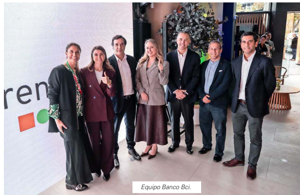
Equipo Banco Bci.

Esta sucursal refleja una evolución en la forma en que atendemos a nuestros clientes. Hoy muchas operaciones se realizan digitalmente, pero las decisiones financieras más complejas siguen requiriendo asesoría y atención personalizada".