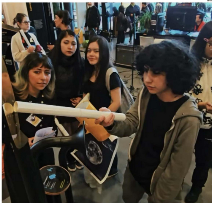
EL VIERNES SE REALIZÓ LA APERTURA OFICIAL DE LA EXPOSICIÓN QUE ESTARÁ ABIERTA HASTA JUNIO.

La exposición está compuesta por 12 módulos interactivos y una serie de paneles gráficos que permiten conocer los principales elementos del Sistema Solar. El recorrido está organizado en cinco ejes temáticos: "Dejando la Tierra atrás", "La Luna y sus ciclos", "El Sol, la estrella del Sistema Solar", "Ocho mundos diversos" y "Los