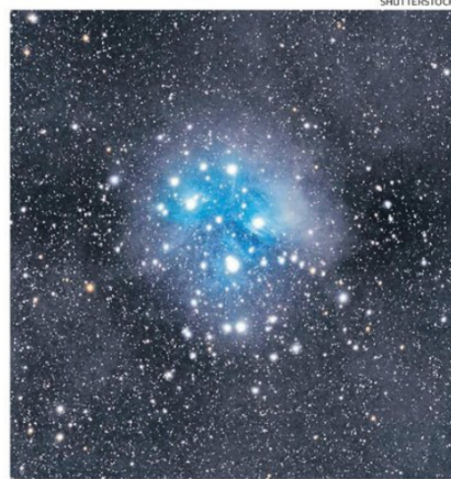
EL SISTEMA ANALIZA DECENAS DE MILES DE SUPERNOVAS A LA VEZ.

La gran aportación del método es su capacidad para estimar distancias con una precisión comparable a la de las medidas espectroscópicas, pero prescindiendo de la necesidad de obtener espectros de luz.