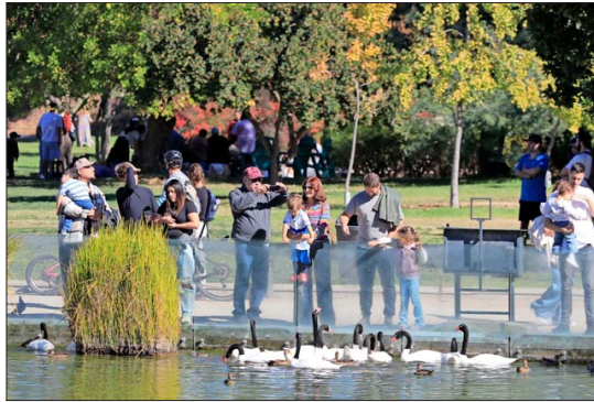
CALOR. — Aprovechando el clima cálido, las familias disfrutaron de los parques y el aire libre.

Durante el recorrido, los asistentes caminaron por sectores emblemáticos del centro junto a un guía turístico, quien relató la historia y destacó el valor patrimonial de la zona.