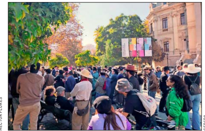
ASISTENCIA. — Cientos de personas participaron del "Paseo Mundial con Sombrero 2026".

Celebración. Plazas, restaurantes, centros comerciales, tuvieron mayor asistencia de familias que buscaron celebrar el Día de la Madre.