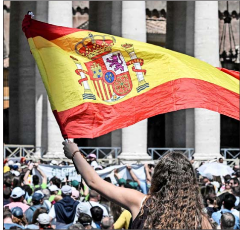
UNA JOVEN española asiste a la oración del Regina Coeli en el Vaticano.

Los datos de esta última fueron, a su vez, aún más reveladores al marcar un repunte de 14 puntos porcentuales entre los jóvenes que se identifican como católicos, en momentos en que un 38,4% de las personas de entre 15 y 29 años en España considera la religión como un aspecto "muy o bastante importante" en sus vidas, una cifra récord en la