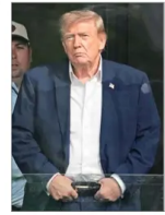
"Acabo de leer la respuesta de los llamados representantes de Irán. No me gusta. ¡Totalmente inaceptable!", postó ayer el Presidente Donald Trump en su red social Truth Social.

Se aleja un acuerdo entre EE.UU. e Irán y Washington evalúa suspender el impuesto a la gasolina | A 4