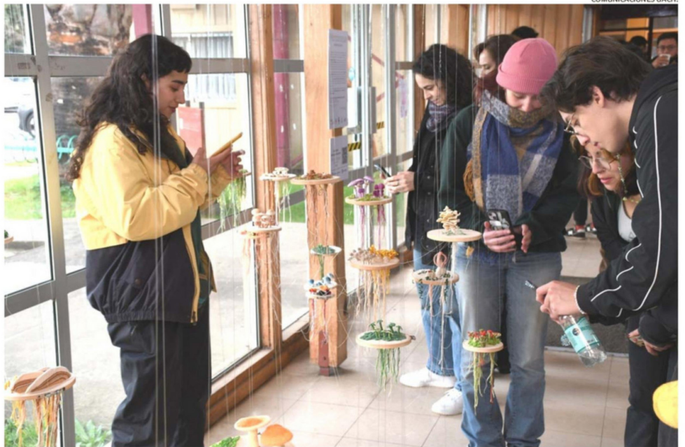
LA MUESTRA, DISPONIBLE HASTA EL PRÓXIMO 7 DE JUNIO, SE INSPIRA EN MICROBOSQUES DE LA RESERVA BIOLÓGICA HUILO HUILO Y EL ARBOLETUM.

La muestra está disponible de forma gratuita hasta el próximo 7 de junio en el hall de la Facultad de Ciencias Forestales y Recursos Naturales de la UACH, en el campus Isla Teja.