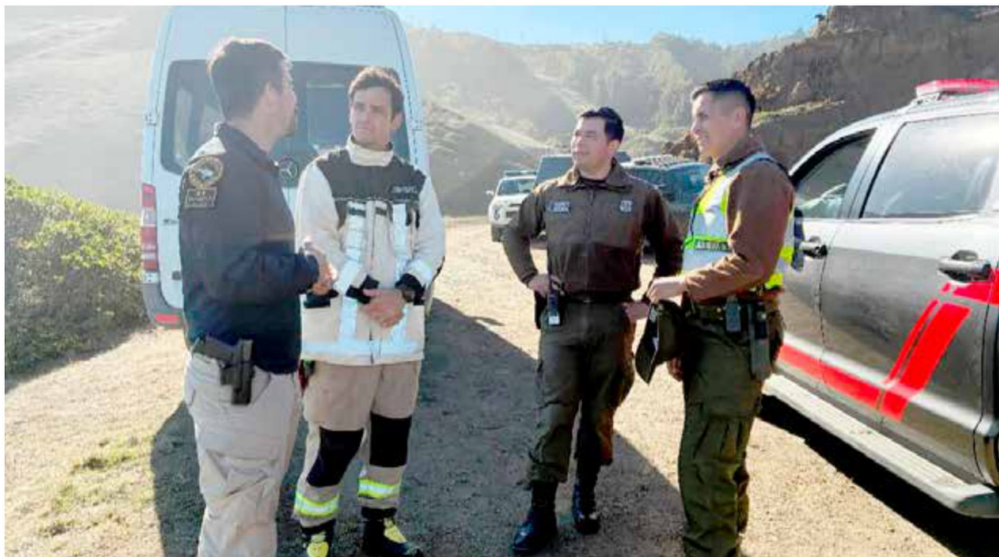
Organismos de emergencia sigue en terreno en búsqueda de la persona extraviada.

No hay que olvidar que en el accidente perdieron la vida dos pescadores y un tercero sobrevivió tras nadar a la orilla y alertar de la tragedia.