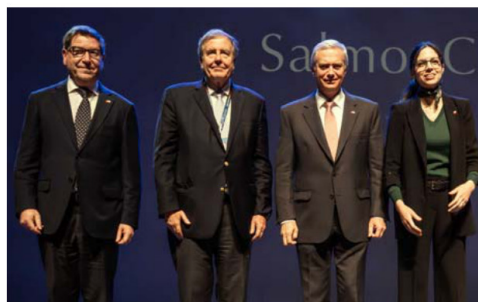
Daniel Mas, biministro de Economía, Turismo y Fomento y de Minería; Patricio Melero, presidente de SalmonChile; José Antonio Kast, Presidente de la República, y Francisca Toledo, ministra del Medio Ambiente.