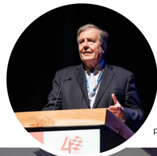
Patricio Melero, presidente de SalmonChile, destacó la relevancia del sector para el desarrollo del sur austral del país.

Con un atractivo programa que permitió una conversación de gran nivel entre altos ejecutivos de empresas emblemáticas del país, autoridades de Gobierno y el Presidente de la República, José Antonio Kast, la tercera versión del SalmonChile Summit fue el espacio para debatir sobre el futuro de Chile y medidas concretas para potenciar este relevante sector productivo.