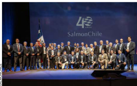
El foro, realizado en el Teatro del Lago en Frutillar, reunió a representantes de la salmonicultura, autoridades, empresariado y el mundo académico, con el fin de abordar los desafíos y oportunidades que enfrenta la actividad acuícola nacional.