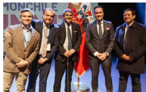
Marcelo Santana, gobernador regional de Aysén; Sergio Giacaman, gobernador regional del Biobío; Alejandro Santana, gobernador regional de Los Lagos; Rodrigo Wainraihgt, alcalde de Puerto Montt, y Marco Silva, alcalde de Calbuco.