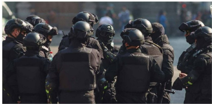
► Del total, 775 son exfuncionarios de Carabineros y 256 son exfuncionarios de FFAA.

safío no es sólo aumentar dotaciones, sino avanzar decididamente en profesionalización, formación, estandarización operativa y coordinación institucional".