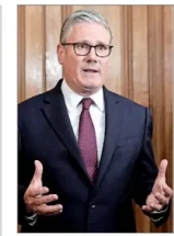
Primer Ministro británico, Keir Starmer, busca relanzar su mandato, mientras crece la sombra de una rebelión interna tras debate electoral del laborismo. | A 4

Crucero con hanta Desde anticuerpos de alpacas hasta los de personas que superaron la enfermedad: científicos chilenos buscan una cura para el virus Andes. | A 10