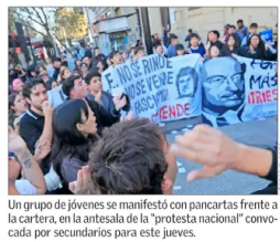
Un grupo de jóvenes se manifestó con pancartas frente a la carter, en la antecala de la "protesta nacional" convocada por secundarios para este jueves.

Tras reducir quorum de 30% a 20%, estudiantes de la U. de Chile eligen a su nueva federación | C 1