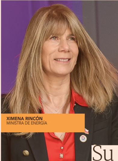
XIMENA RINCÓN MINISTRA DE ENERGÍA