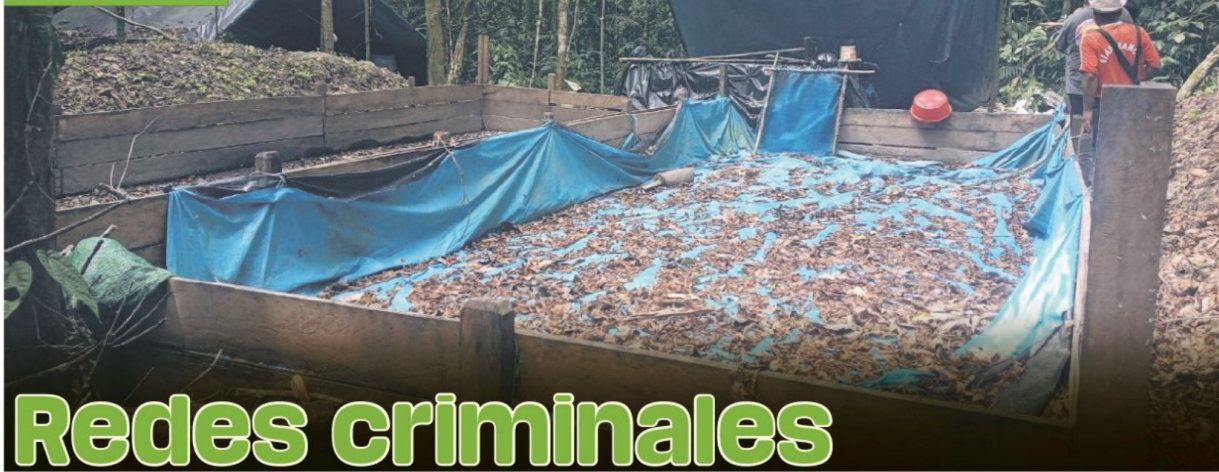
Cultivos ilegales de coca en Unipacuyacu, Amazonia de Perú.