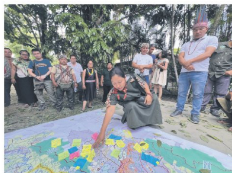
Según el estudio la mejor estrategia de seguridad en territorios indígenas es el respeto de sus derechos, la autodeterminación y la participación de los pueblos.

da criminalista o militarista de las economías extractivas ilícitas. Esto distorsiona cualquier posibilidad de afrontar los problemas que se encuentran detrás de los campamentos mineros, de las pozas de maceración, de la deforestación de bosques".