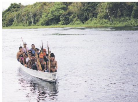
Los pueblos indígenas enfrentan cambios en su forma de vida debido a las economías ilegales.

Las diferentes formas de violencia contra mujeres, niños, niñas y adolescentes indígenas quedan reflejadas