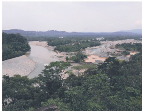
La minería ilegal destruye bosques y afecta a las comunidades indígenas de la Amazonía.

toman como base el análisis que hicieron en siete escenarios territoriales en Brasil, Colombia, Ecuador, Perú y Venezuela así como los testimonios recogidos durante el Encuentro Internacional de Defensores y Defensoras de Brasil, Colombia, Ecuador y Perú, que se realizó en febrero en la ciudad de Pucallpa, en la Amazonía peruana.