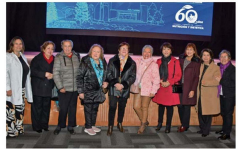
TITULADAS HISTÓRICAS Y EXACADÉMICAS PARTICIPARON EN ACTIVIDAD.