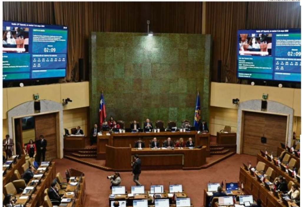
LAS COLECTIVIDADES QUE MÁS MODIFICACIONES ANUNCIARON SON LA DC Y EL PDG.