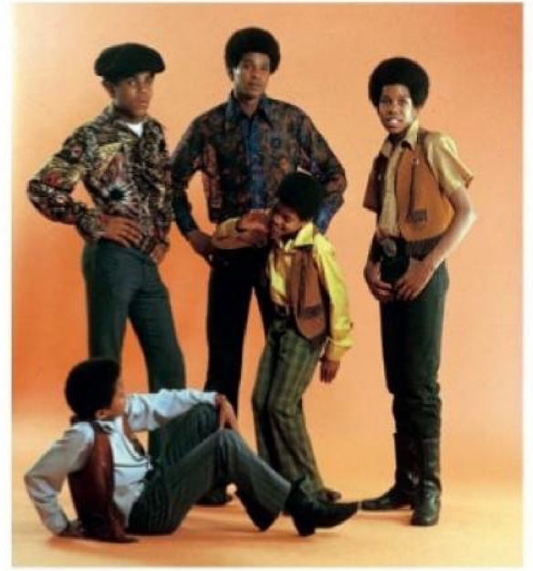
Los hermanos Prince, Paris y Bigi Jackson han mantenido viva la memoria de su padre a través de apariciones públicas y homenajes.

ocultar la verdad, alimentando una sensación de amenaza constante.