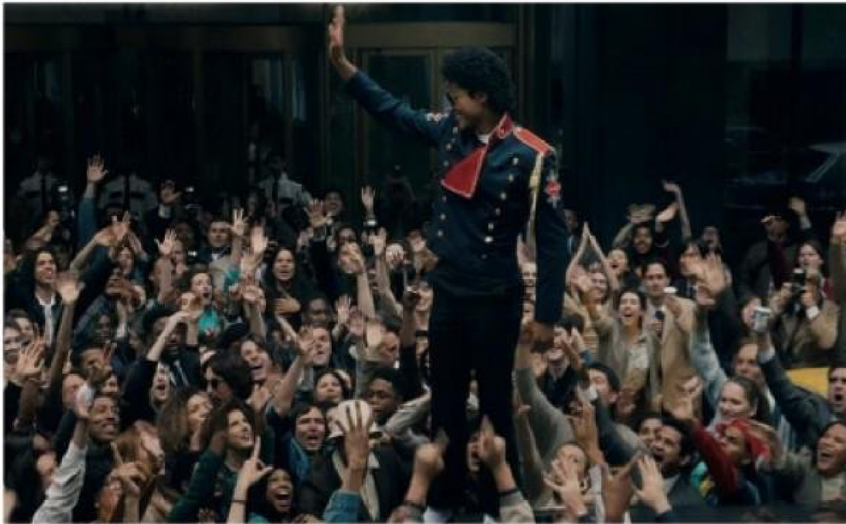
Michael Jackson ha logrado un repunte en su popularidad gracias a su nueva película biográfica.

barnos a más cosas, como besos, sexo oral, y él me decía que eso era un vínculo especial que teníamos y me decía cosas como: 'Sólo hago esto contigo', o 'Te quiero muchísimo'. Y hacía muchas cosas para demostrármelo. Ya sabes, algunas de las cosas que hacía eran... bebía mi orina y me decía: 'Esto es lo mucho que te quiero'.