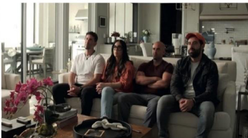
Ahora como adultos, los hermanos Cascio definen a Michael Jackson como “un monstruo”.

En un nuevo documental titulado Michael Jackson’s “secret” second family break their silence presentado por 60 Minutos Australia, los hermanos Cascio acusan a Michael Jackson de haber abusado sexualmente de cada uno de ellos desde su infancia, aprovechando la confianza familiar y su acceso privilegiado a lujos, giras y una convivencia marcada por la admiración. Afirman que durante años los aisló, los obligó a guardar silencio median-