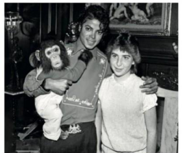
Michael Jackson con su chimpancé "Bubbles" y una fan.