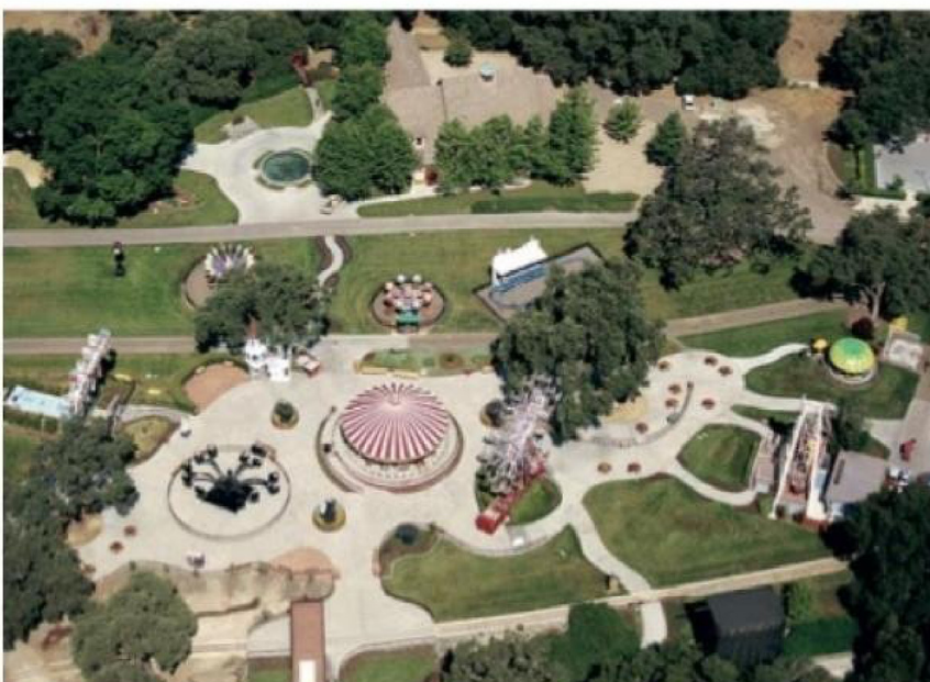
En Neverland, Michael Jackson organizó eventos benéficos y recibió a miles de niños y admiradores de todo el mundo.