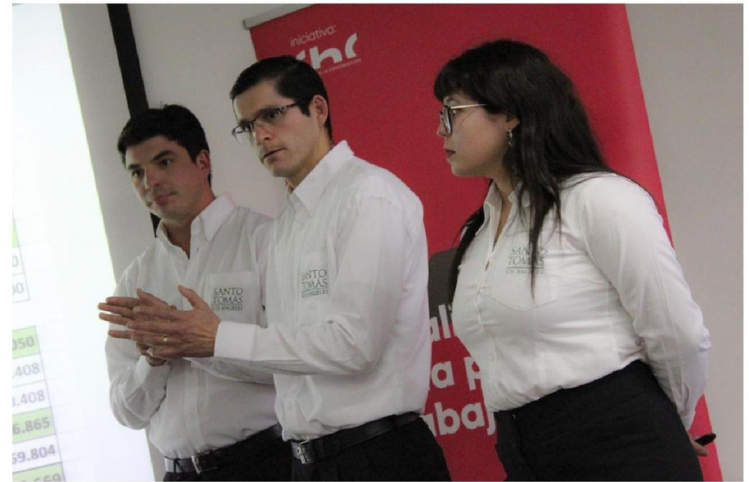
EL PLAZO DE POSTULACIÓN se extendió hasta el 24 de mayo próximo.

Esto está aperturado para todas las disciplinas, no es excluyente para el área de construcción, sino específicamente, está aperturado para estudiantes de educación superior con un alcance nacional.