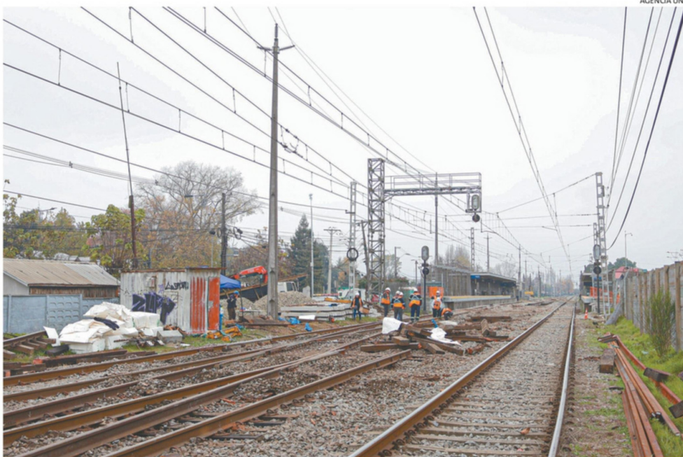
DESRIELO OCURRIÓ CERCA DE LA ESTACIÓN CHIGUAYANTE.

“Cabe señalar que estos componentes habían sido recientemente suministrados por el fabricante e instalados en el carro, y conta-