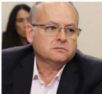
Diputado Bernardo Salinas (IND-PC)